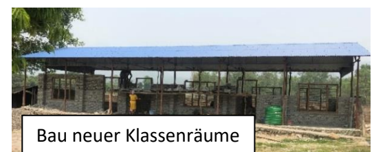
Bau neuer Klassenräume