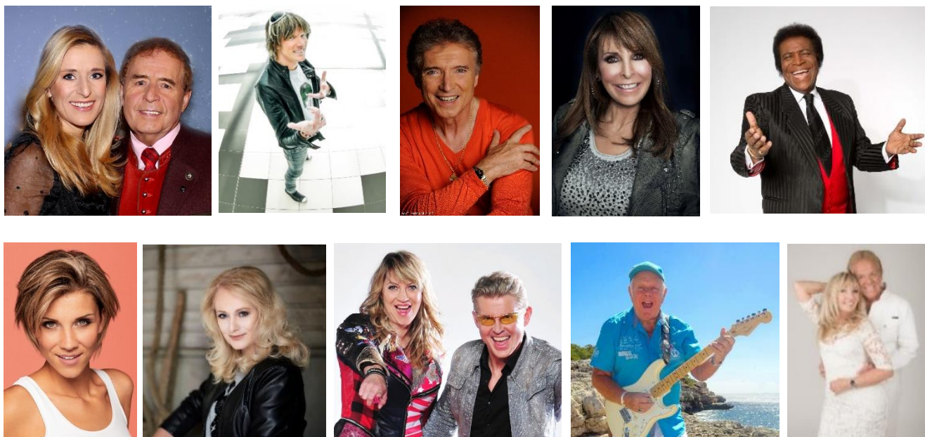
Zumutbare Künstleränderungen vorbehalten.