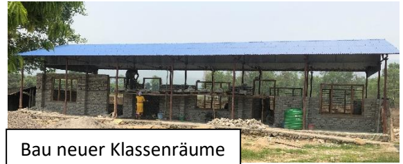
Bau neuer Klassenräume

Gemeinde Unterstützung und Richtlinien zur Förderung der Gemeinschaft und zur Verbesserung des Lernumfelds. Nach Fertigstellung des Gebäudes und Abschluss der Maßnahmen (voraussichtlich im Feb. 2023) wird die Schule 150 Kindern einen Schulplatz in einer neuen und kindgerechten Schule bieten können.